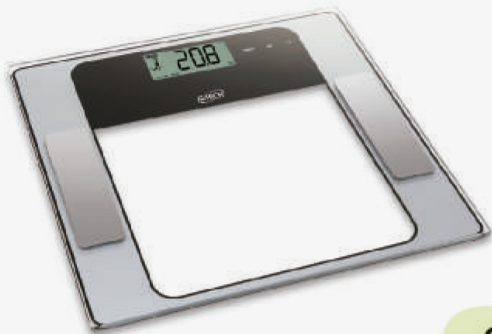
Glass 7 FW

COM MEDIÇÃO DE ÁGUA, GORDURA, MASSA MUSCULAR E MASSA ÓSSEA