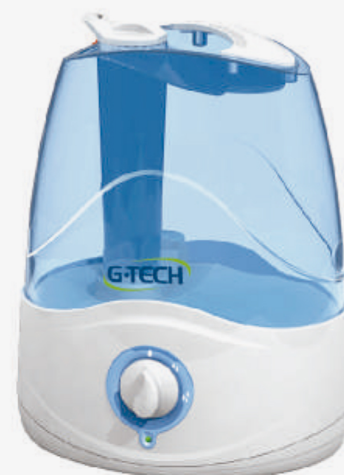
Tabela comparativa entre os umificadores