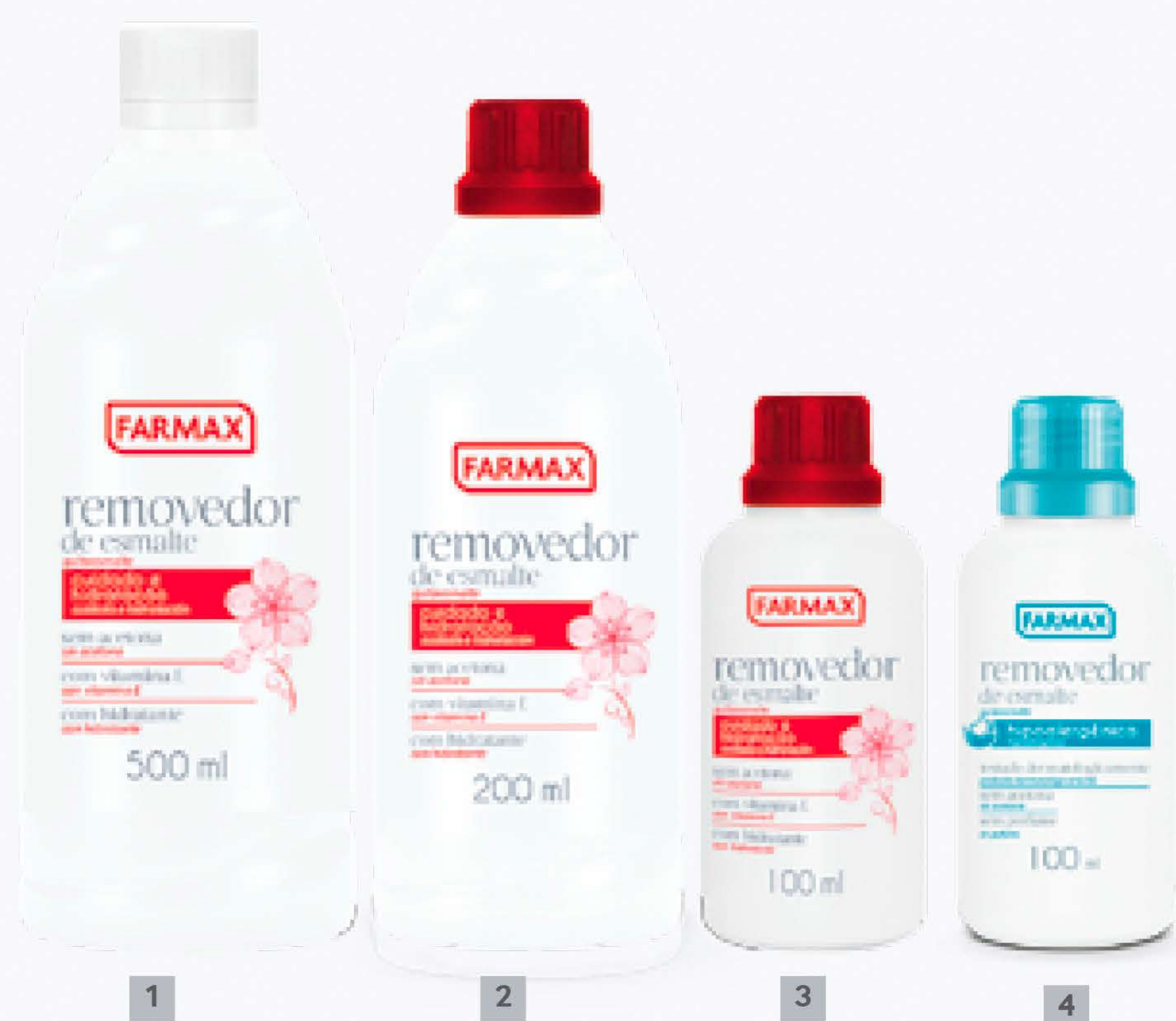
1 2 3 4

Os removedores fazem parte da categoria Acessórios para Unhas . Nesta categoria, a Farmax é líder pelo 12º ano consecutivo no canal supermercadista, segundo a Pesquisa Mais Mais da revista SuperVarejo . A fórmula é mais eficiente contendo glicerina.