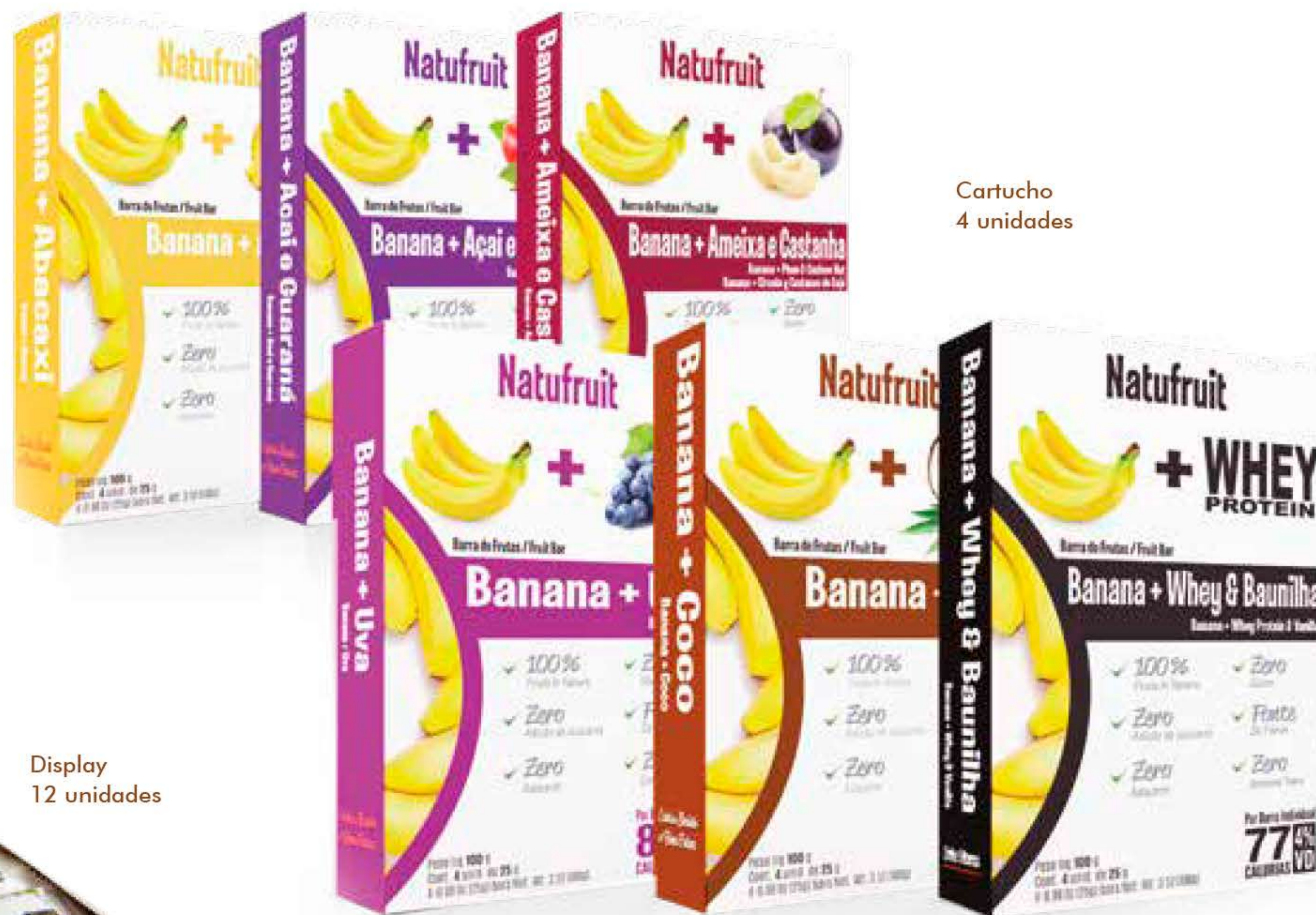
Cartucho 4 unidades