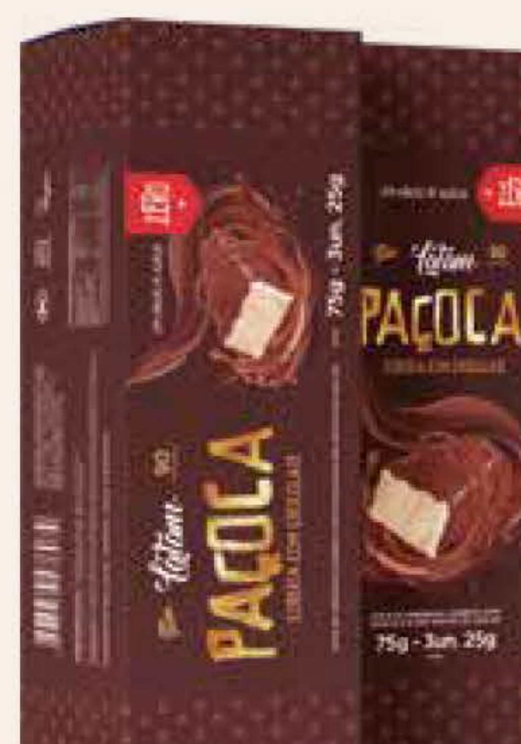
CARTUCHO 3 UNIDADES