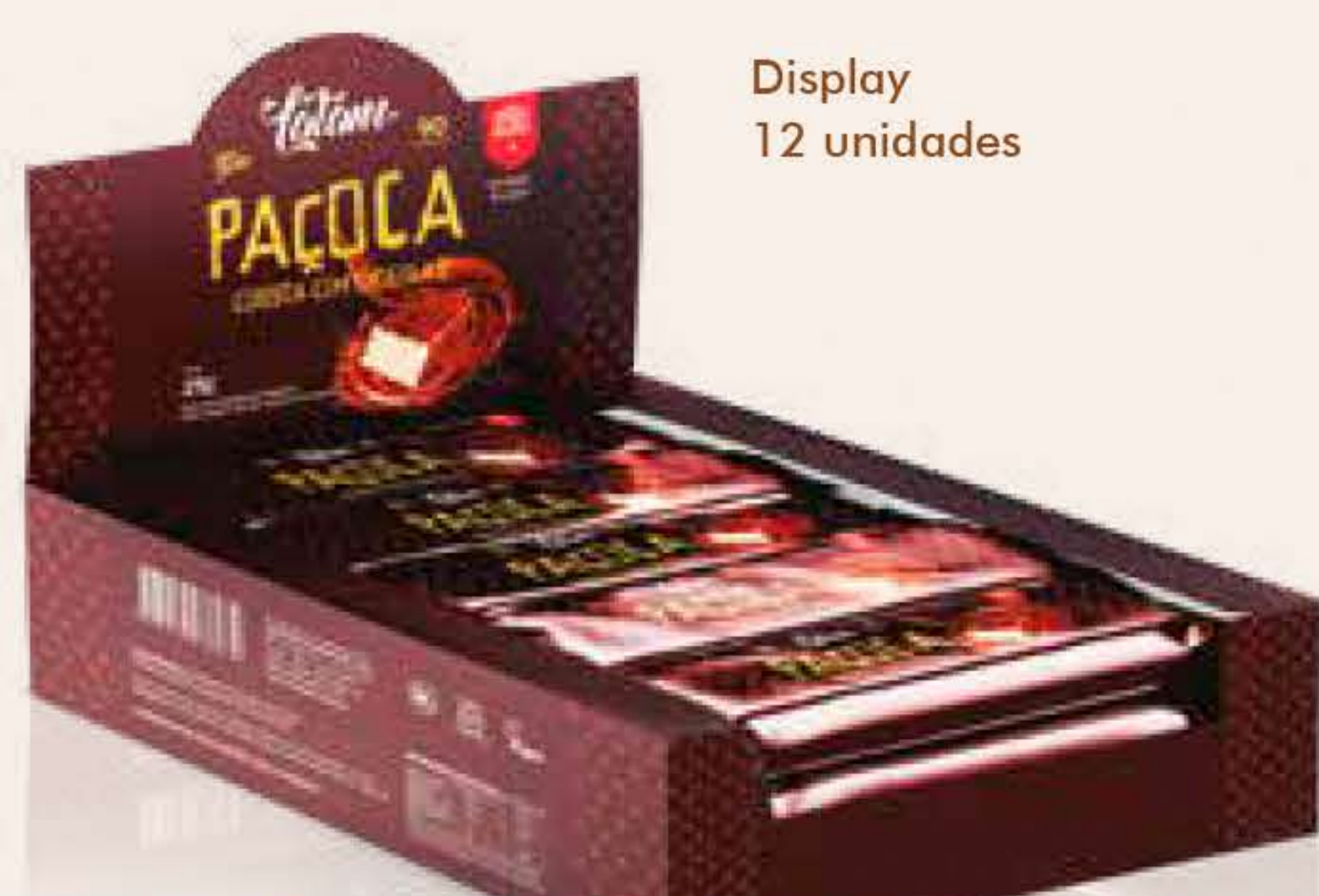
Display 12 unidades