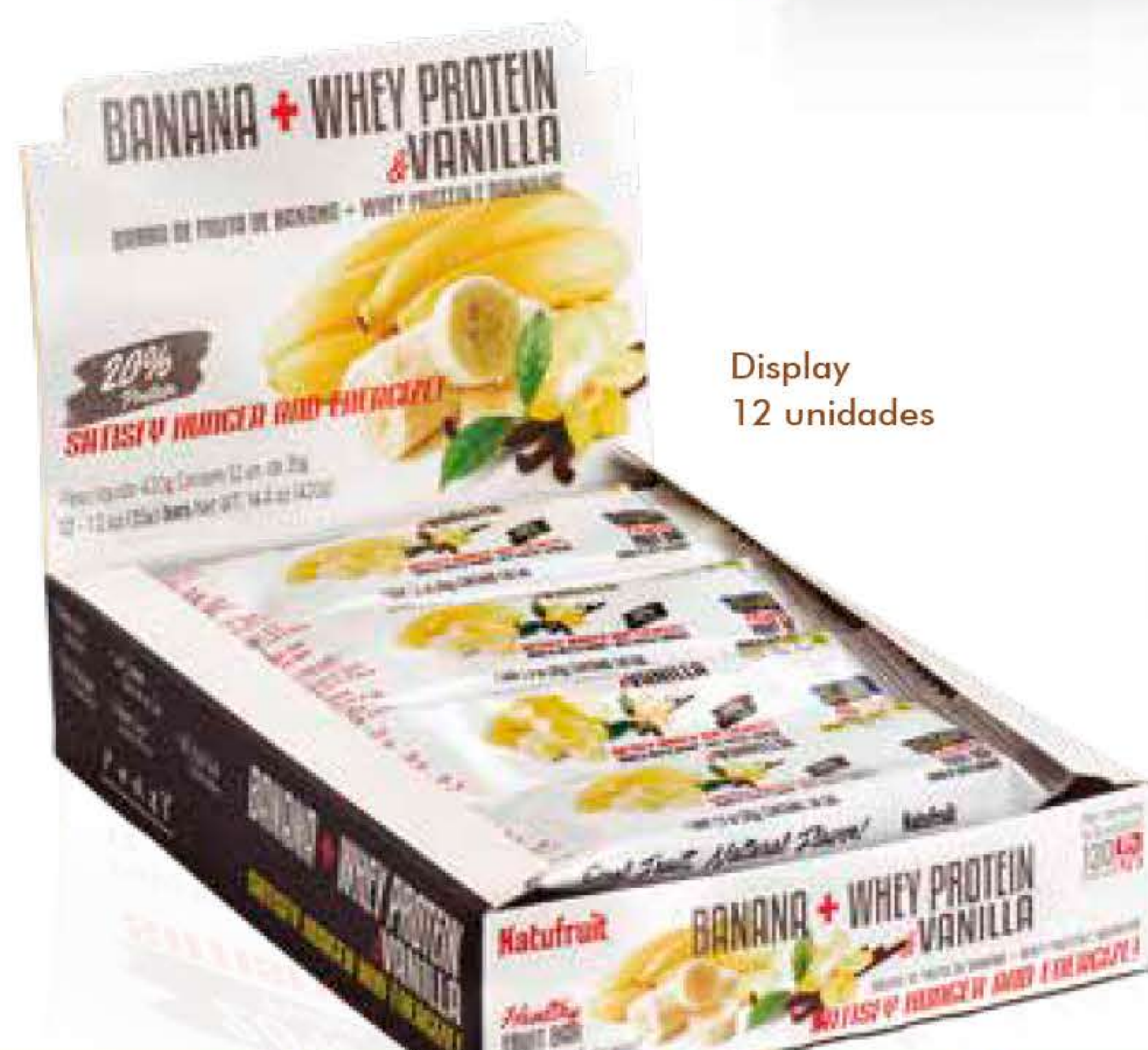
Display 12 unidades